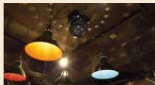
パーティーに遊び要素を+