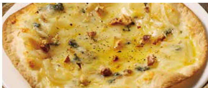
淡路玉葱とゴルゴンゾーラのピッツァ Gorgonzola Cheese Pizza with AWAJI ONION