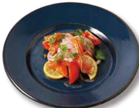
スモークサーモンのレモンマリネ Lemon Marinated Smoked Salmon