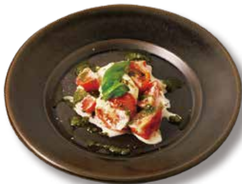
ブルータチーズとトマトのカプレーゼ バジル風味 Burrata cheese and tomato caprese with basil