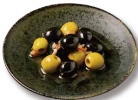
バルバラマーケットのオリーブマリネ Marinated Olives