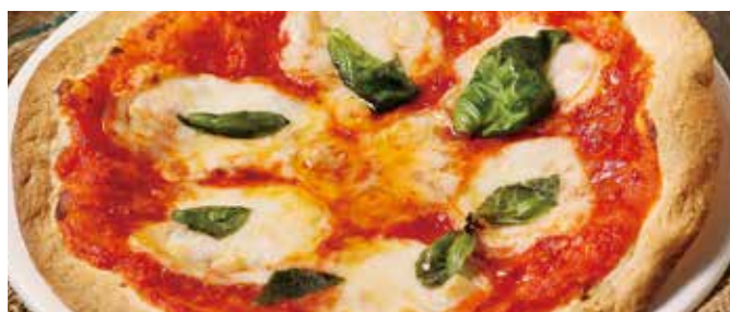
定番マルゲリータ Classic Pizza Margherita