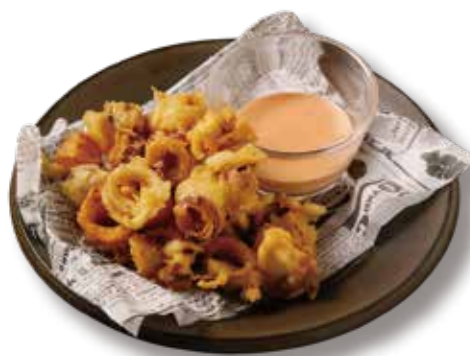
ヤリイカのセモリナ粉フリット Fried Calamari