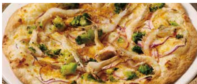
白海老とカラスミのおつまみピッツァ Snack Pizza with Glass Shrimp & Dried Mullet Roe