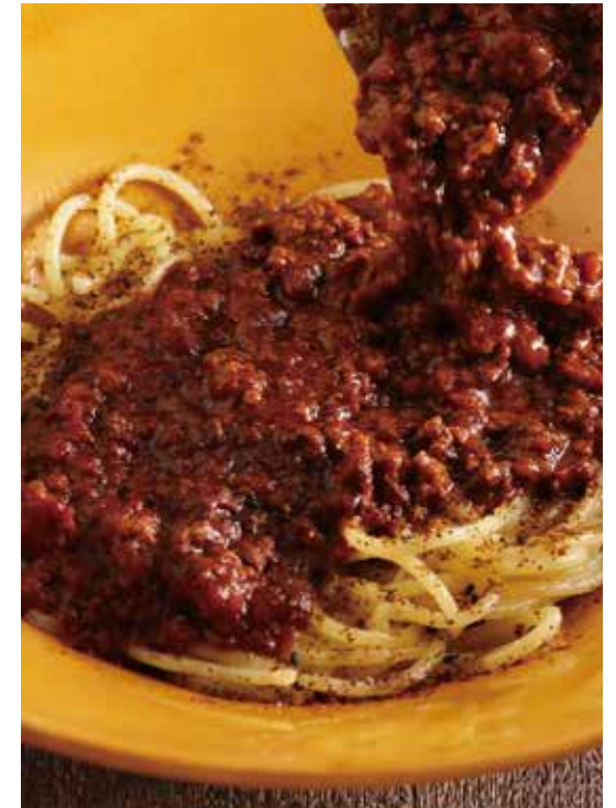
⑦ 淡路産牛の黒ボロネーゼ 1527円 (税込1680円)

淡路産牛と白ごま、豆乳を合わせた、こななの“白”ボロネーゼ。淡路産牛のしっかりとした旨味と、生姜の香りが食欲をそそります。白ごま豆乳のまろやかなソースとパスタ麺がよく絡み、食べ応えのある贅沢な一皿。