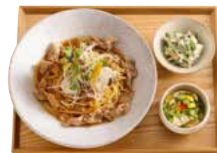
おばんざいセット +455円 (税込500円)