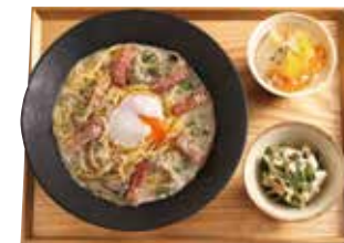
豆乳プリンセット +455円 (税込500円)