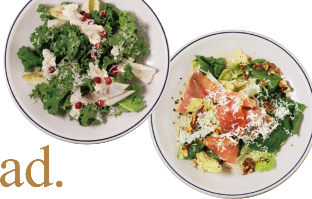
Mushroom and Oil Sardine Salad マッシュルームとオイルサーディンのサラダ