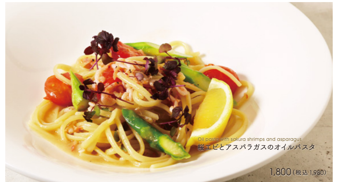
Oil pasta with sakura shrimps and asparagus 桜エビとアスパラガスのオイルパスタ