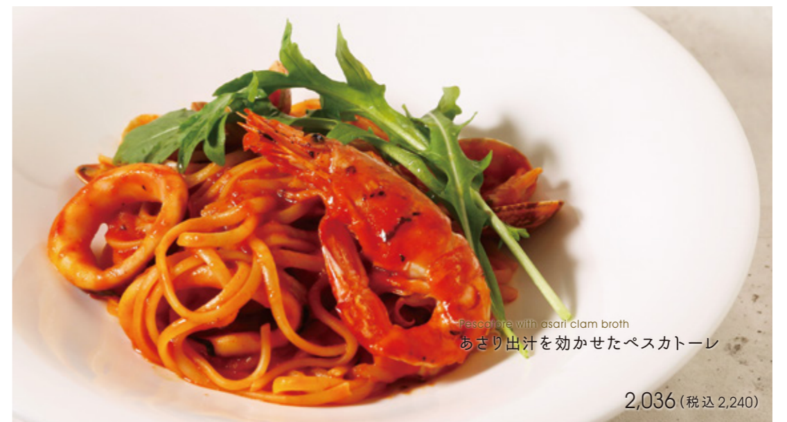
Pescatore with asari clam broth あさり出汁を効かせたペスカトーレ