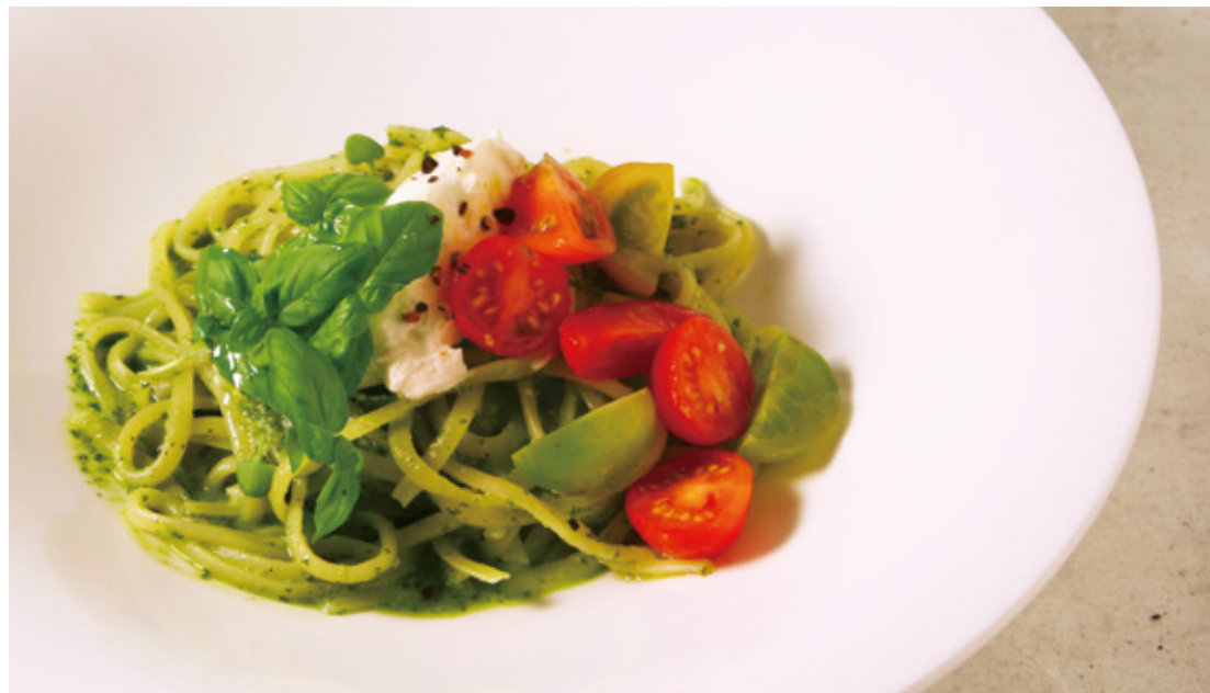
Genovese pasta with colorful tomatoes and ricotta cheese カラフルトマトとリコッタチーズのジェノベーゼパスタ

シロニワのパスタは自家製麺もあります。真空の状態ですり上げた、コシの強い生地を独自の方法で寝かせることでモチモチ食感の生パスタに。