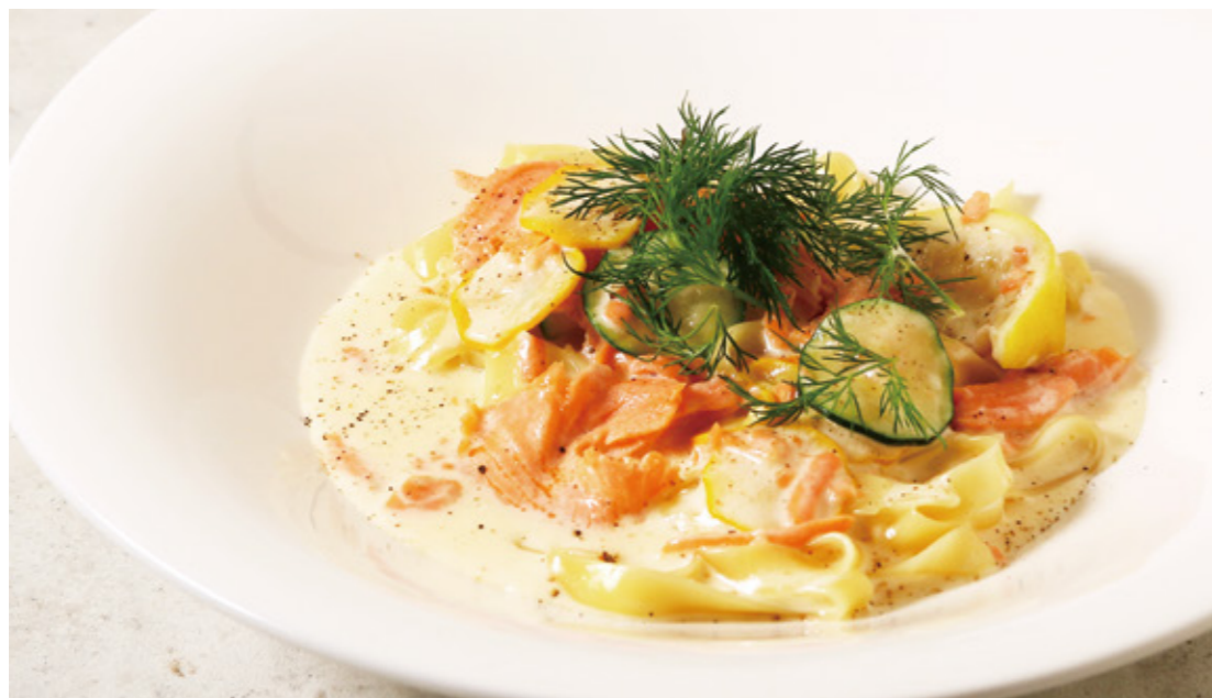
Lemon Cream Pasta with Smoked Salmon and Zucchini スモークサーモンとズッキーニのレモンクリームパスタ