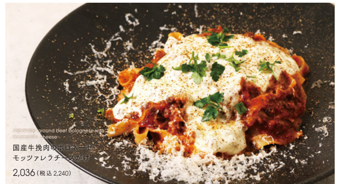
Japanese ground beef bolognese with mozzarella cheese