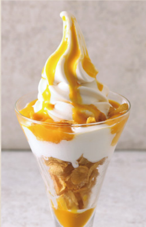
Mango & Coconut Cream Sundae