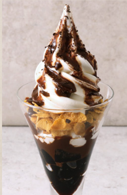
Coffee Jelly Sundae