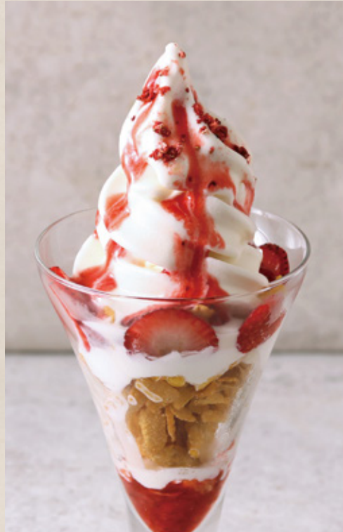
Strawberry & Yogurt Cream Sundae

ココナツクリームと相性抜群のごろっと果肉のマンゴーを 合わせたフルーティなサンデー