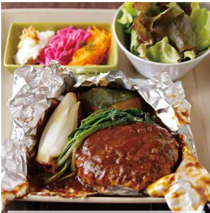
HAMBURG STEAK WITH ONION DEMI GLACE SAUCE /1380 ハンバーグ オニオンデミグラスソース