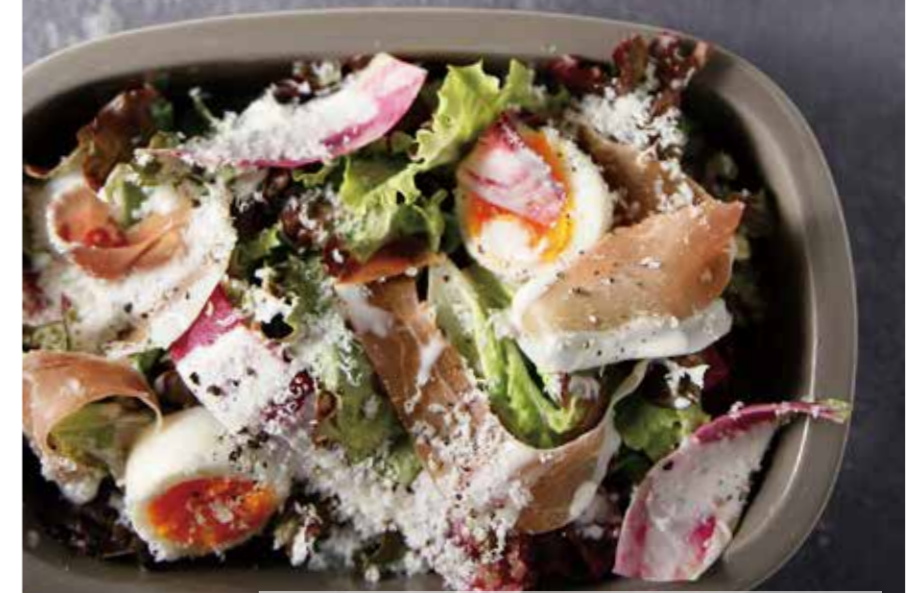
□ CAESAR SALAD OF UNCURED HAM WITH GRANA PADANO / 880 削りたてグラナパダーノと生ハムのシーザーサラダ