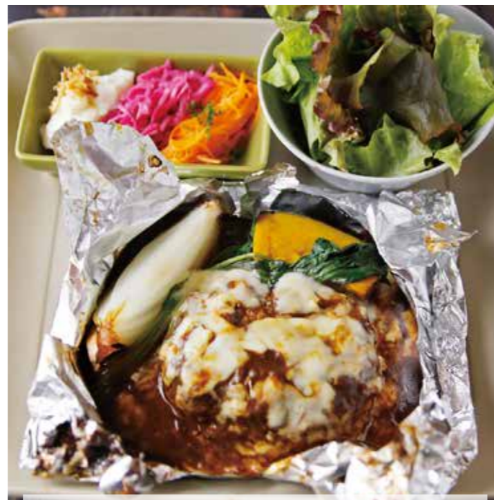
CHEESE HAMBURG STEAK WITH ONION DEMI GLACE SAUCE /1480 チーズハンバーグ オニオンデミグラスソース