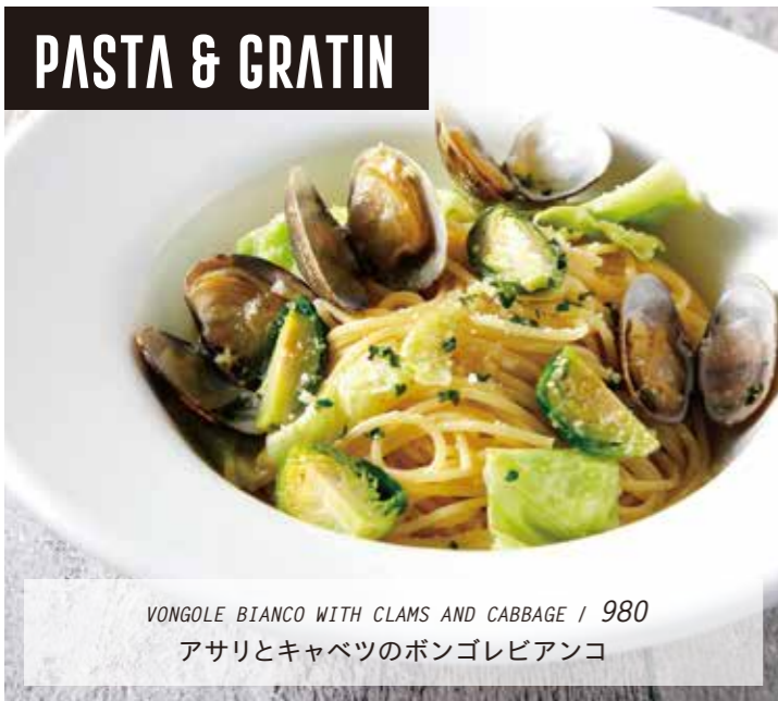
VONGOLE BIANCO WITH CLAMS AND CABBAGE / 980 アサリとキャベツのボンゴレピアンコ