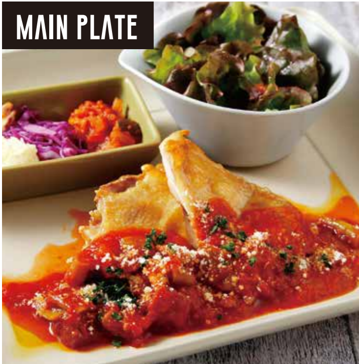
CHICKEN ROAST WITH SPRING BEANS AND TOMATO SAUCE /1280 チキンロースト 春豆とトマトのソース