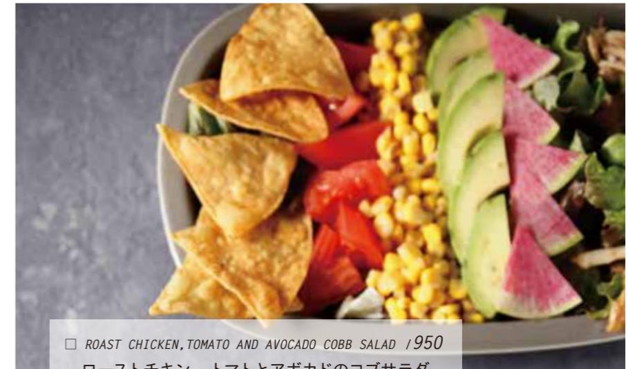
□ ROAST CHICKEN, TOMATO AND AVOCADO COBB SALAD / 950 ローストチキン、トマトとアボカドのコブサラダ