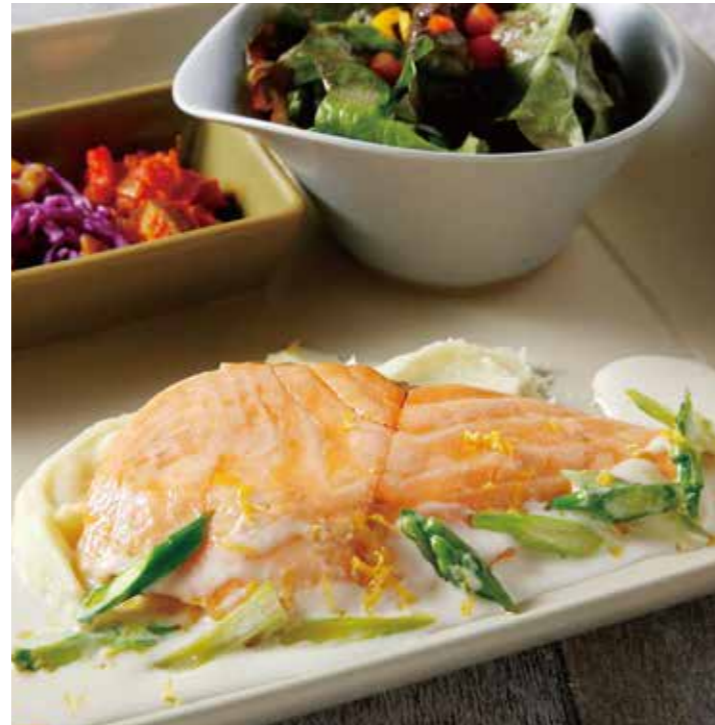
SALMON ROAST AWAJI LEMON CREAM SAUCE /1360 サーモンロースト 淡路産レモンクリームソース