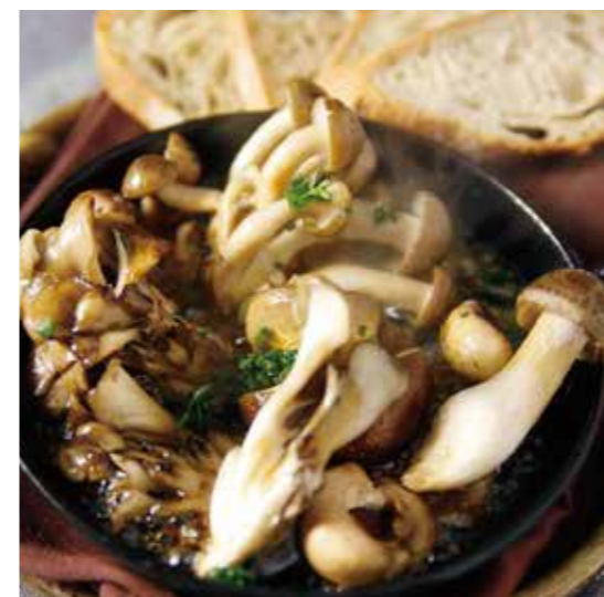
□ MUSHROOMS AJILLO いろいろキノコのアヒージョ 焦がし醤油風味 / 780