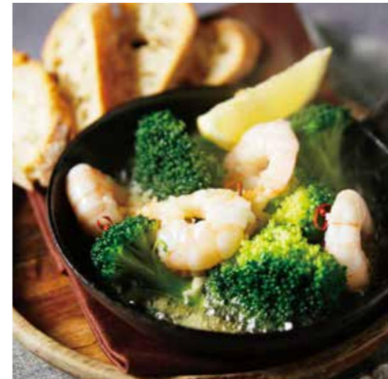
□ SHRIMP AND BROCCOLI AJILLO 海老とブロッコリーのアヒージョ / 780