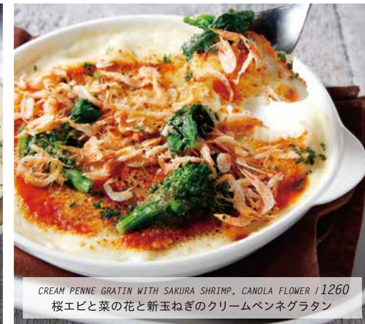
CREAM PENNE GRATIN WITH SAKURA SHRIMP, CANOLA FLOWER /1260 桜エビと菜の花と新玉ねぎのクリームペネグラタン