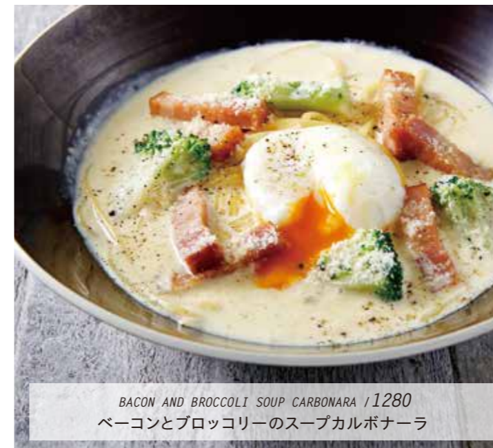
BACON AND BROCCOLI SOUP CARBONARA /1280 ベーコンとブロッコリーのスープカルボナーラ

国産小麦『キタノカオリ』をベースに、『淡路島産の米粉』や『淡路島産おのころしずく塩』を使い、ほどよくもちりと軽めの食感を考え配合したカラース自家製生地のピザをお楽しみください。