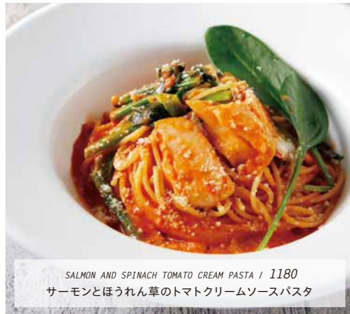
SALMON AND SPINACH TOMATO CREAM PASTA / 1180 サーモンとほうれん草のトマトクリームソースパスタ