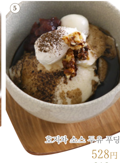
호지차 소스 두유 푸딩 528원 음료 세트 913원