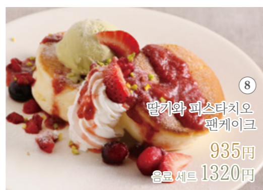
딸기와 피스타치오 팬케이크 935원 음료 세트 1320원