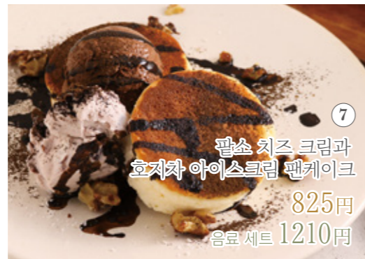
팥소 치즈 크림과 호지차 아이스크림 팬케이크 825원 음료 세트 1210원