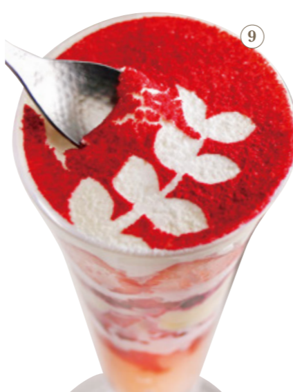
딸기 티라미수 파르페 979원 음료 세트 1364원