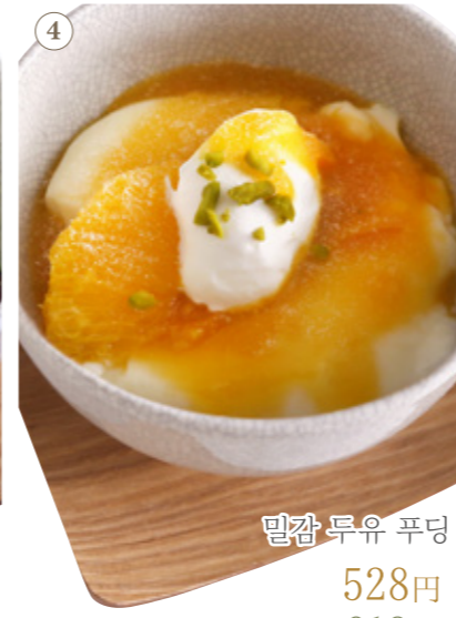
밀감 두유 푸딩 528원 음료 세트 913원