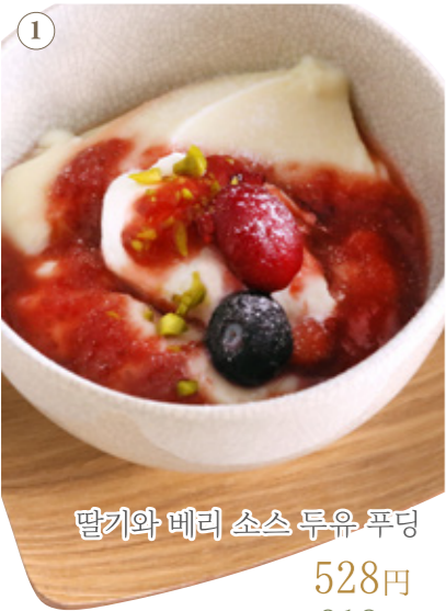
딸기와 베리 소스 두유 푸딩 528원 음료 세트 913원