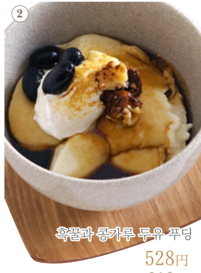
흑꿀과 롱카루 두유 푸딩 528원 음료 세트 913원