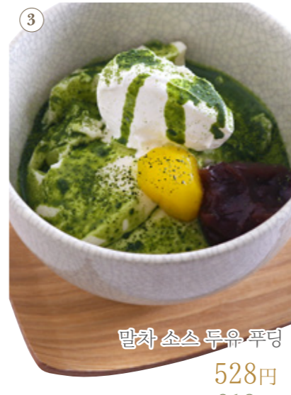
말차 소스 두유 푸딩 528원 음료 세트 913원