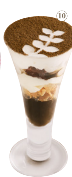
호지차 / 말차 티라미수 파르페 858원 음료 세트 1243원