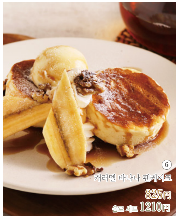
캐러멜 바나나 팬케이크 825원 음료 세트 1210원