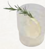
Flavored Water フレーバーウォーター