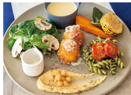
BARBARA deli plate.