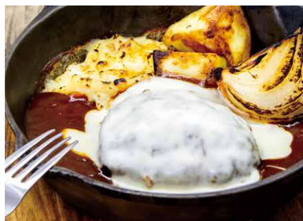
Hamburg with onion demiglace sauce.