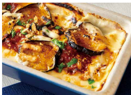
Awaji beef minced meat and fried eggplant penne gratin