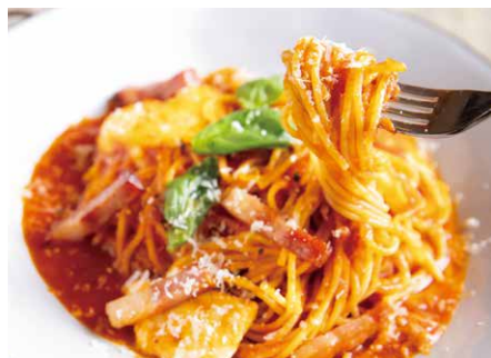
Kobe basil and mozzarella cheese Tomato pasta