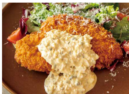
Breaded chicken cutlet made with awaji island chicken breast, served with homemade tartar sauce