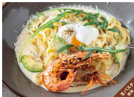
Kitasaka sakura egg, red shrimp and avocado carbonara - style pasta