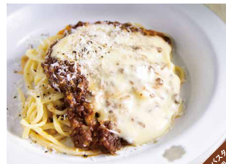
Bolognese pasta with awaji beef, topped with cheese fondue