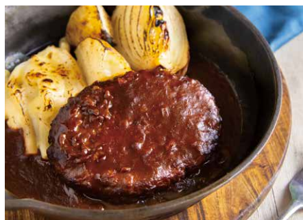
Hamburg with onion demiglace sauce.