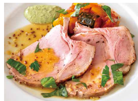
Roast pork with sangen pork tomato stew of summer vegetable mustard&basil sauce