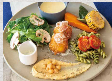
BARBARA deli plate.