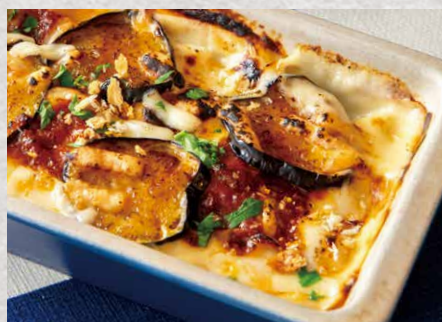
Awaji beef minced meat and fried eggplant penne gratin