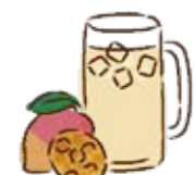
□ マンゴーマッコリ